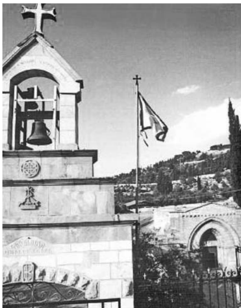
Недалеко от крепостной стены Старого Иерусалима находится храм Гроба Пресвятой Богородицы и рядом армянская колокольня

добрался до церкви Бадара-Птрецик. Вечера, когда мы искали следы второй церкви в одном селе, я поскользнулся буквально на ровном месте, упал, ушиб колено и порвал брюки. А коп осмотрел мои кроссовки, погладил их отполированную от долгого ношения подошву и сказал: «Надо срочно поку-